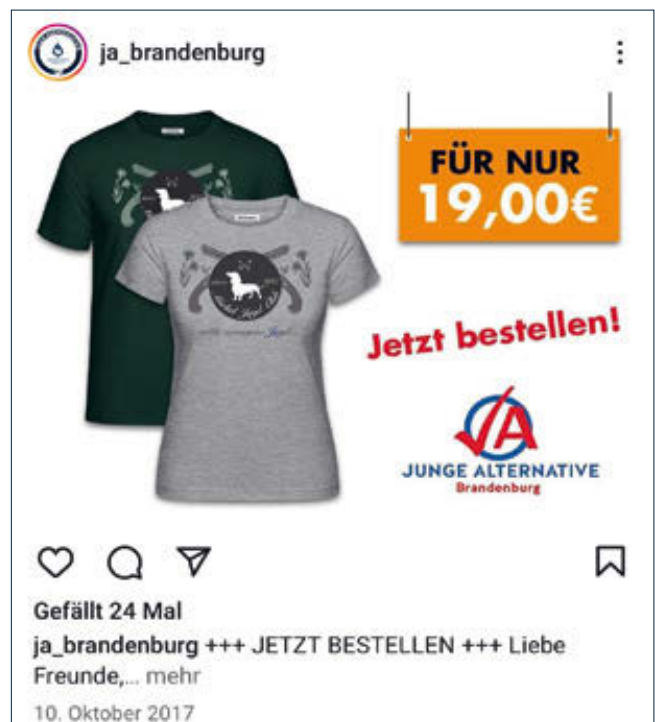
T-Shirt-Motiv „Merkel Jagd Club“ mit Waffen und Kornblumen. Screenshot.

rechtsextreme Compact Magazin interviewen. Auf Social Media teilte er ein Musikstück der militant-antisemitischen Cottbuser Neonazi-Band Hassgesang (Hohm 2017a). Hohm suchte die Nähe zum rechtsextremen Institut für Staatspolitik (IfS), der Identitären Bewegung (IB) und dem Kampagnenbüro Ein Prozent (Fröhlich/Jansen 2019).