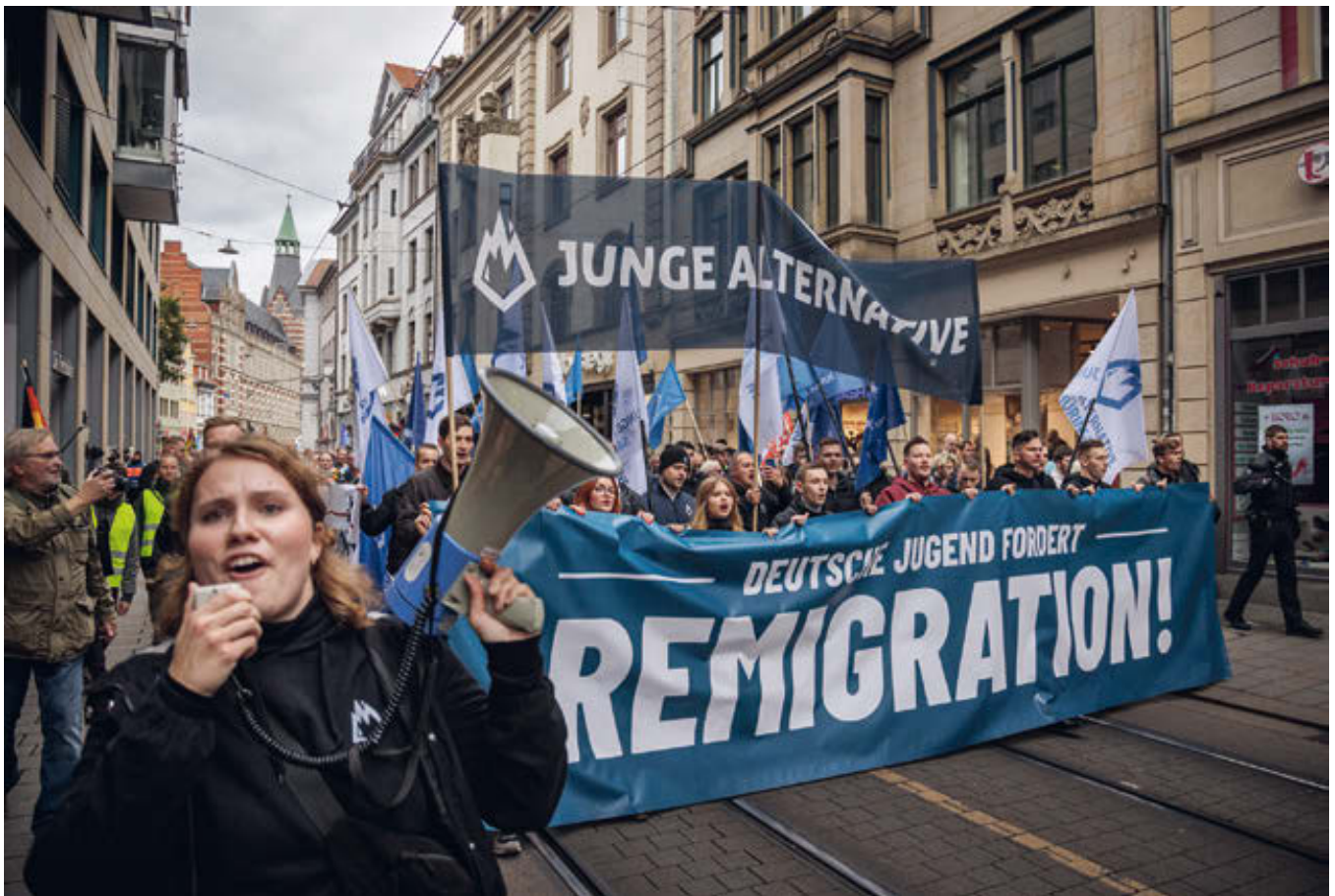
Demonstration 2023 in Erfurt.

Die Rezeption und Übernahme des Konzepts in der JA ist unübersehbar. Ein auf Einladung der JA Brandenburg gehaltenes Referat des Autors zu seinem Thema wird über den zentralen Youtube-Kanal der Bundes-JA verbreitet (JA TV 2020). In einem Interview bezieht sich der JA-Gründungsvorsitzende Hohm ebenfalls darauf (Konflikt Magazin 2021). In der ersten Folge des von der JA Brandenburg produzierten Podcasts „Mit offenem Visier“ bezeichnet