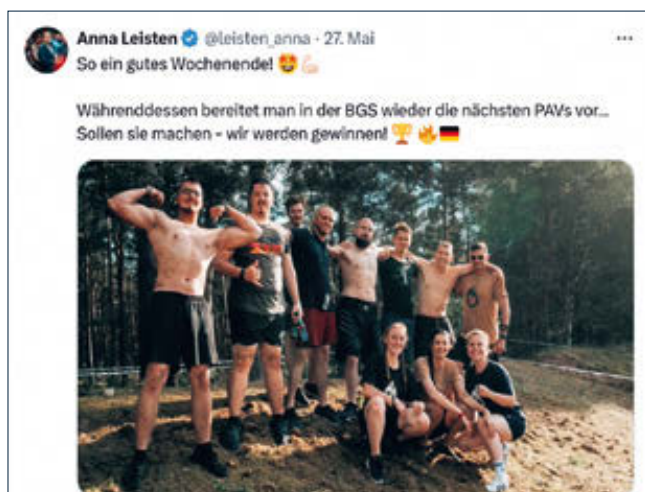
JA Brandenburg nach einem Hindernislauf 2024. Screenshot.

Mit einer auf Medienaufmerksamkeit zielenden Aktion, wie sie zuvor Markenzeichen der „Identitären Bewegung“ waren, sorgte die JA im Juni 2023 für Aufmerksamkeit. Eine neunköpfige Gruppe um den Landesvorstand posierte dafür an einem Gebäude der Universität Potsdam, dem Nordflügel der Communs des Neuen Palais, mit einer Deutschlandfahne und Fahnen der JA (Leisten 2023d). Anlass war der von rechtsextremen Netzakteuren ins Leben gerufene „Stolzmonat“, der als Gegenantwort auf den für LGBTQ-Rechte werbenden „Pride Month“ konzipiert ist (Amadeu Antonio Stiftung 2023).