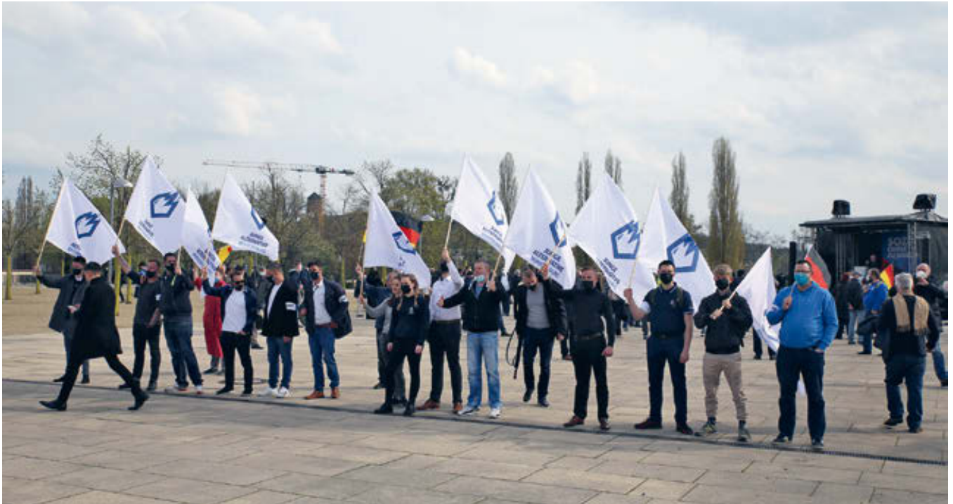
JA-Mitglieder bei einer Kundgebung 2021 in Potsdam.