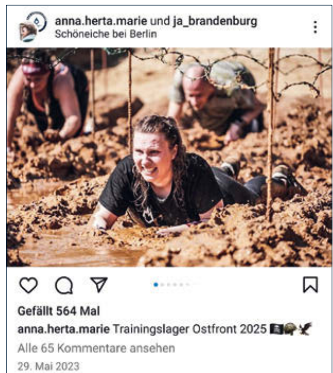
Posting von Anna Leisten. Screenshot.

Gnauck erklärt, dass die JA in seinem Verständnis als eine „kleine zähe und widerstandsfähige Kampfgemeinschaft“ (Gnauck 2021a) wirken solle. Im März 2023 kommentierte die JA Brandenburg ein Posting zur „Migrantenkriminalität“ mit dem Satz: „Unsere Empfehlung: Zuschlagen!“ (JA Brandenburg 2023k) In einem anderen Posting wurde erklärt, dass sich die „deutsche Jugend [...] nicht unterdrücken“ lassen solle, verbunden mit der Forderung: „Seid wehrhaft“