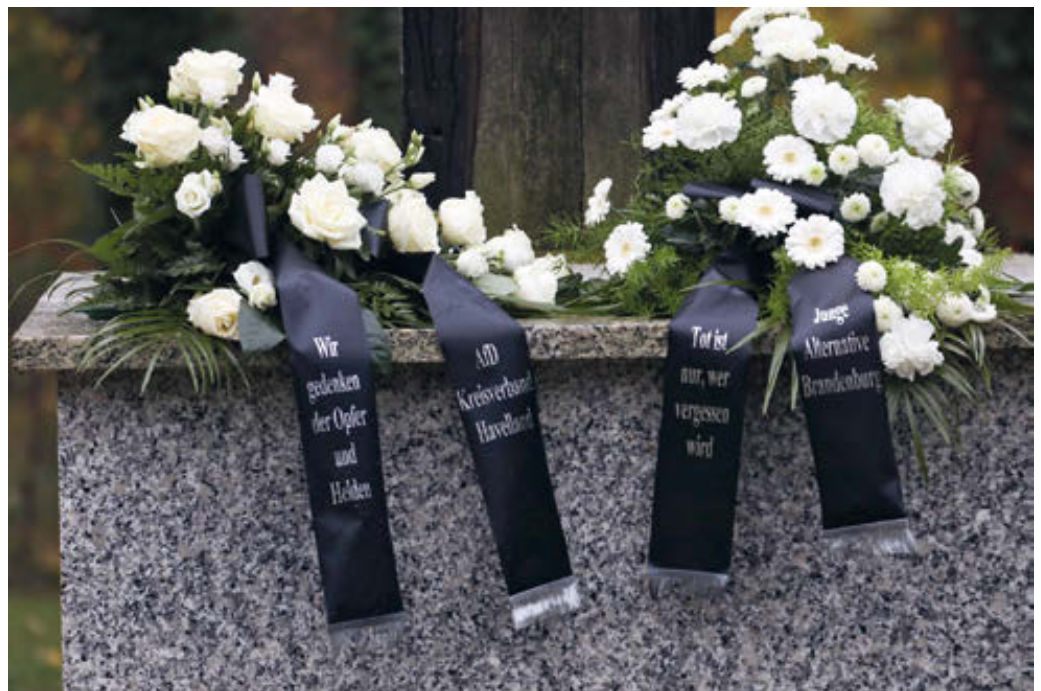
Volkstrauertag 2022 in Rathenow.