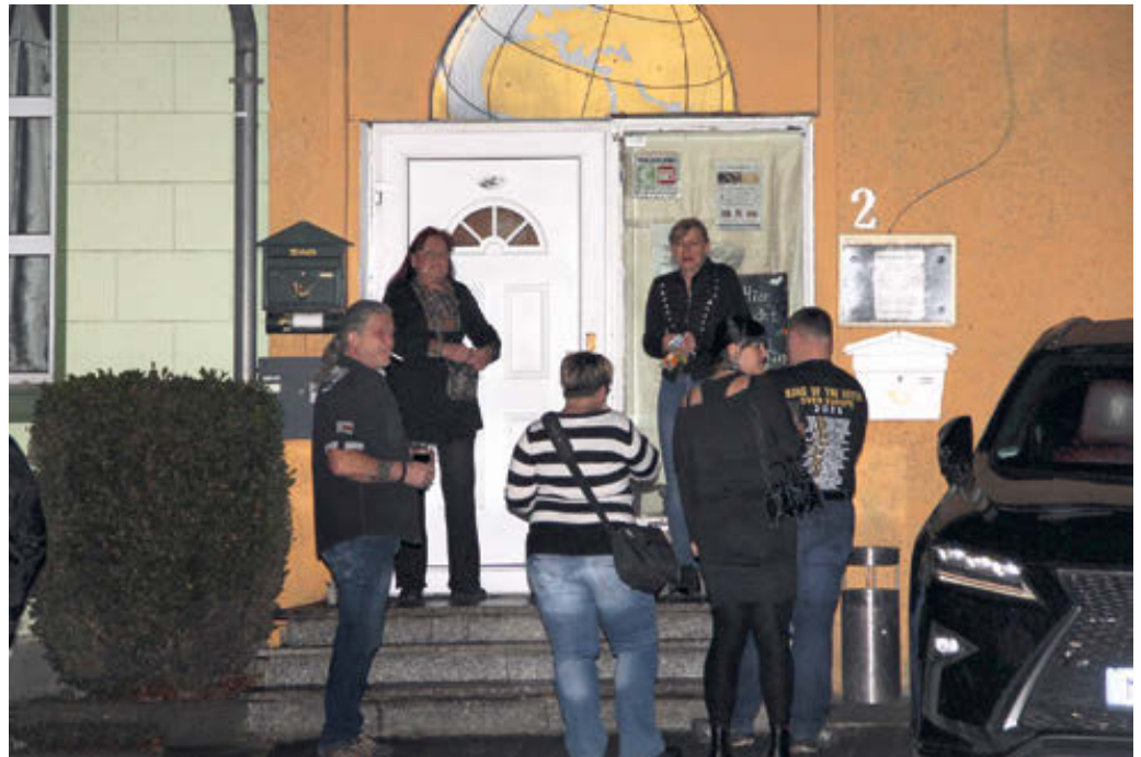
Eingang zu einem Rechtsrockkonzert der JA Brandenburg im Dezember 2023.