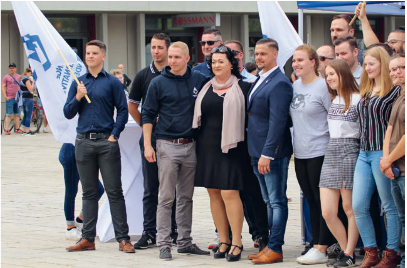
AfD-Sommerfest 2021 in Eberswalde.

Maße zutreffend zu sein (JA Brandenburg 2021c). Der anhaltend starke Rückhalt für die JA in der Brandenburger AfD wurde im August 2023 erneut deutlich, als der ehemalige Bundestagsabgeordnete Roman Reusch versuchte, ein Parteiausschlussverfahren gegen die JA-Landesvorsitzende Leisten einleiten zu lassen, da deren Gebaren nach Reuschs Einschätzung mitverantwortlich für die aus Parteisicht ungünstigen Verfassungsschutzbewertungen seien. Reusch scheiterte nicht nur mit diesem Anliegen, sondern sah sich in der Folge sogar genötigt, seinen Posten im AfD-Landesvorstand aufzugeben (Probst 2023).