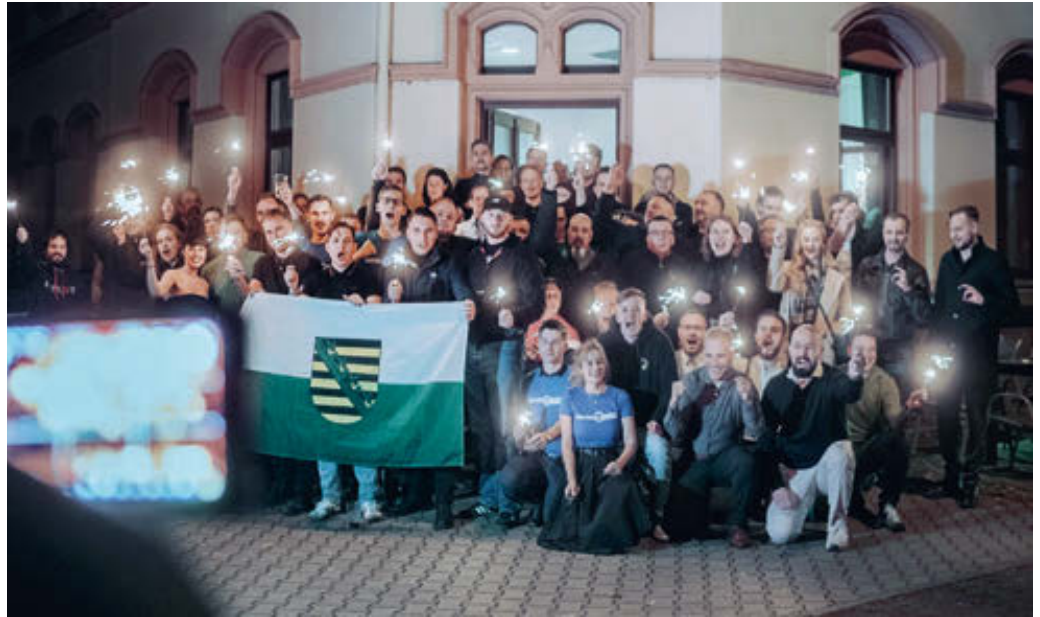
Versammlung am rechtsextremen Zentrum Chemnitz unter Beteiligung von Brandenburger JA-Aktiven. Screenshot.