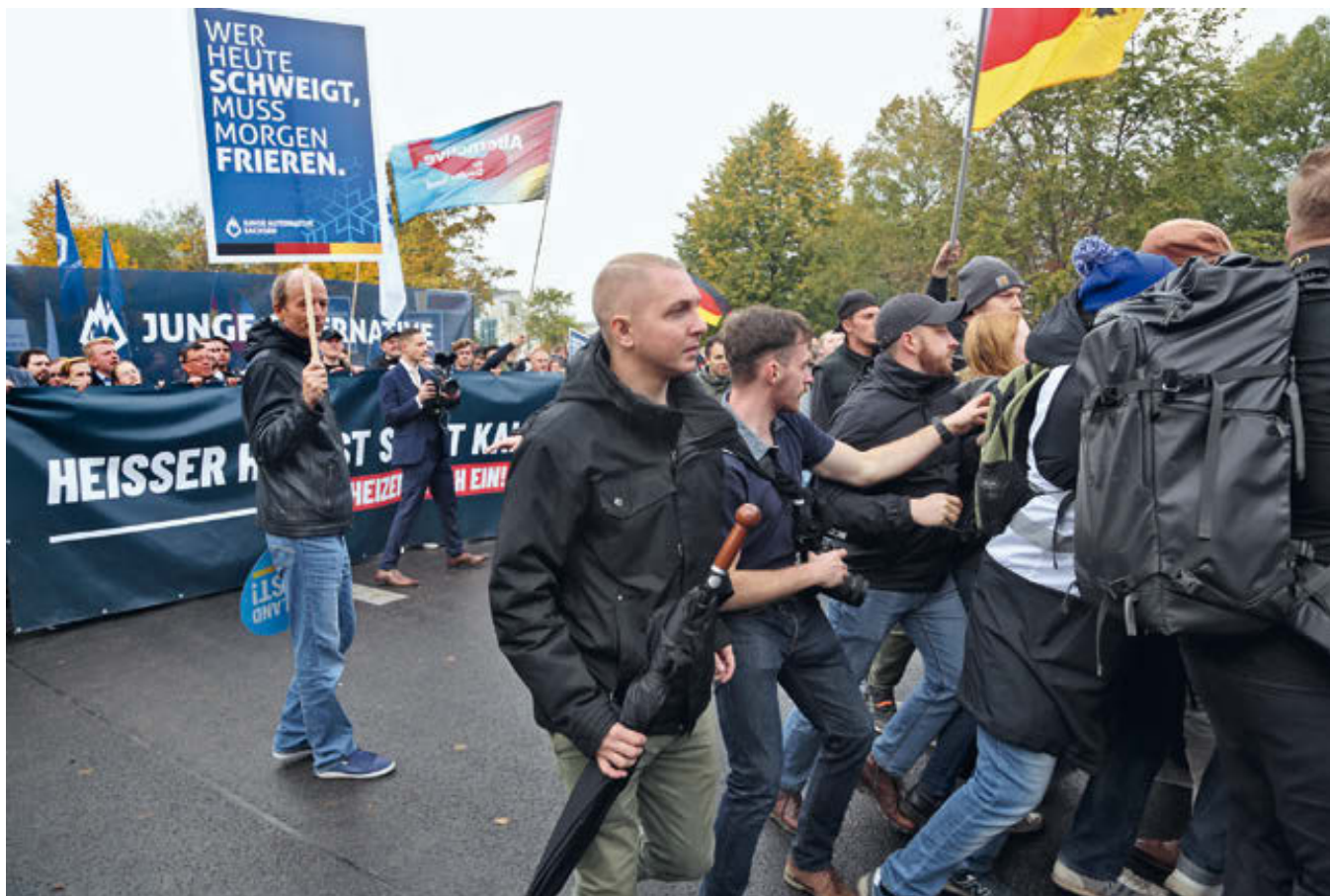
Am Rande einer AfD-Demonstration 2022 in Berlin stürmen Teilnehmende des JA-Blocks auf einen Gegenprotest zu.