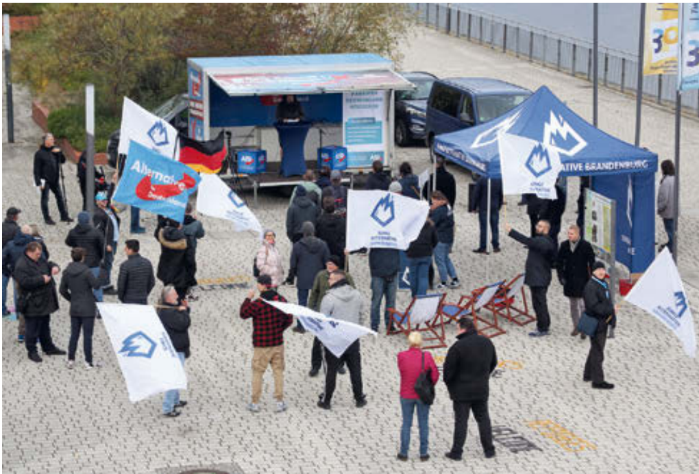
Kundgebung 2021 in Frankfurt (Oder).

rechtsextremen Parole „Umweltschutz ist Heimatschutz“ auf Social Media berichtete (Leisten 2022a, zur Parole vgl. Schulze 2019a).